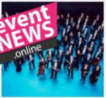
Berlin Deutsche Oper Kammerorchester