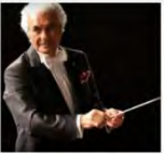
Gürel Aykal Orkestra Şefi