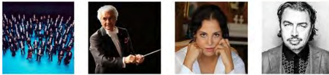
Berlin Deutsche Oper Kammerorchester

Festivalin simgesi, Bodrum ve civarında doğal olarak yetişen "Frenk kaktüsü". Frenk kaktüsü ormanlardan ve bitki örtüsünden yoksun topraklarda bozulmayı azaltmada kullanıldığı gibi, karbondioksiti içinde toplama yeteneğiyle hava kirliliğinin yoğunlaştığı yerlerde bir "çevre kahramanına" dönüşebileceği uzmanlarca ifade edilen bir bitkidir. Bunun yanı sıra yangınlara dayanıklılığı nedeniyle, ormanlık alanlar arasında, olası ateşi kesecek duvarlar oluşturmak için de kullanılırlar. Tüm bu özellikleriyle Frenk kaktüsü, hem dayanıklılığı hem de dünyaya faydayı, iyileşmeyi, iyileştirmeyi ifade ettiği için festivalin simgesi olmuştur.