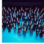
Berlin Deutsche Oper Kammerorchester